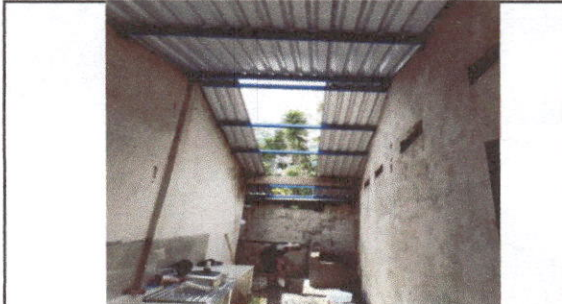
Foto 1: Sustitución de lámina, por lámina troquelada aluzinc calibre 26 Y Sustitución de estructura de soporte de madera, por metal