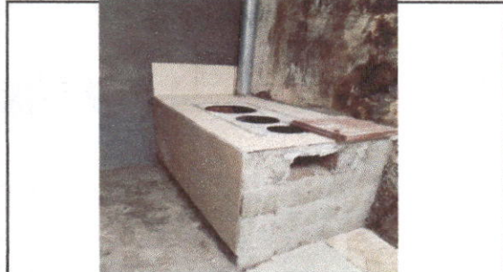
Foto 2: Sustitución de estufa rural (completa) incluye chimenea y plancha de metal